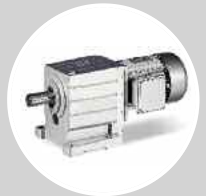
Motoriduttori standard IP65