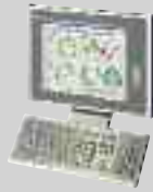
Command Station IP65