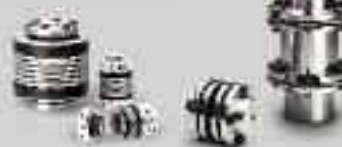
Giunti torsionalmente rigidi