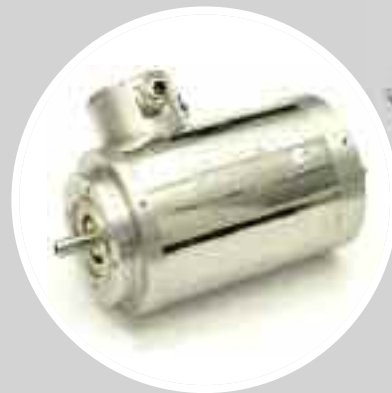
Motore in acciaio inossidabile