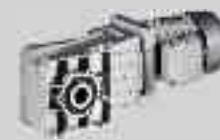
ortogonali leggeri (GSS)