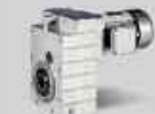
ad assi paralleli (GFL)